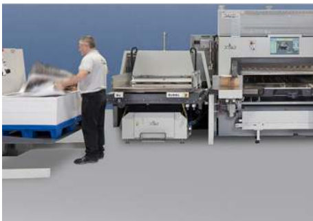
POLAR CuttingSystem PACE

Insgesamt 185 Besucher nutzten die Gelegenheit, um sich auf den PACE Days über Automatisierungsmöglichkeiten beim Schneiden zu informieren. Vom 12. – 16. Mai stand das Kundenzentrum in Hofheim ganz im Zeichen der Optimierung des Schneidprozesses.