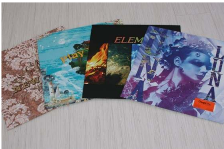
Duprint hat sich auf die Herstellung von Katalogen mit laminierten Umschlägen spezialisiert

Der neue Schnellschneider POLAR N 92 PRO mit Stapellift und dem einzigartigen Nutzenanschlag WiMotion wurde im April bei der Start-up Druckerei Duprint in Betrieb genommen. Erste Ergebnisse zeigen eine Steigerung der Produktivität und des Umsatzes.