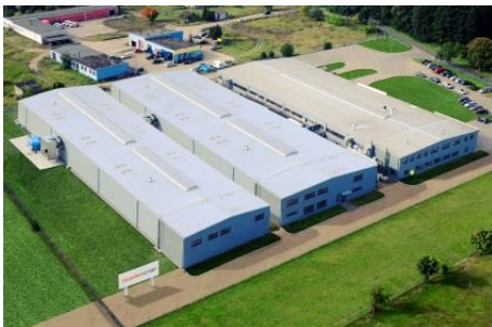
Firmengebäude von Colours Factory

Die polnische Druckerei Colours Factory hat ihren Kundenservice mit einem neuen POLAR Schnellschneider N 176 PRO verbessert. Damit wird die bereits vorhandene POLAR 176 Xplus ergänzt.