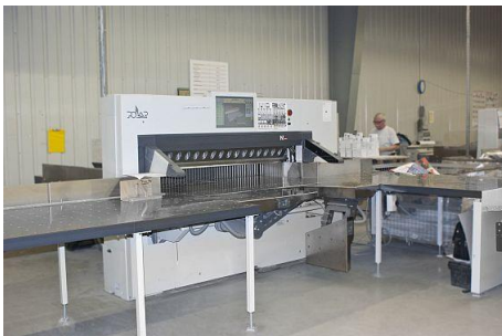
Die neue POLAR N 176 PRO neben der vorhandenen POLAR 176 Xplus