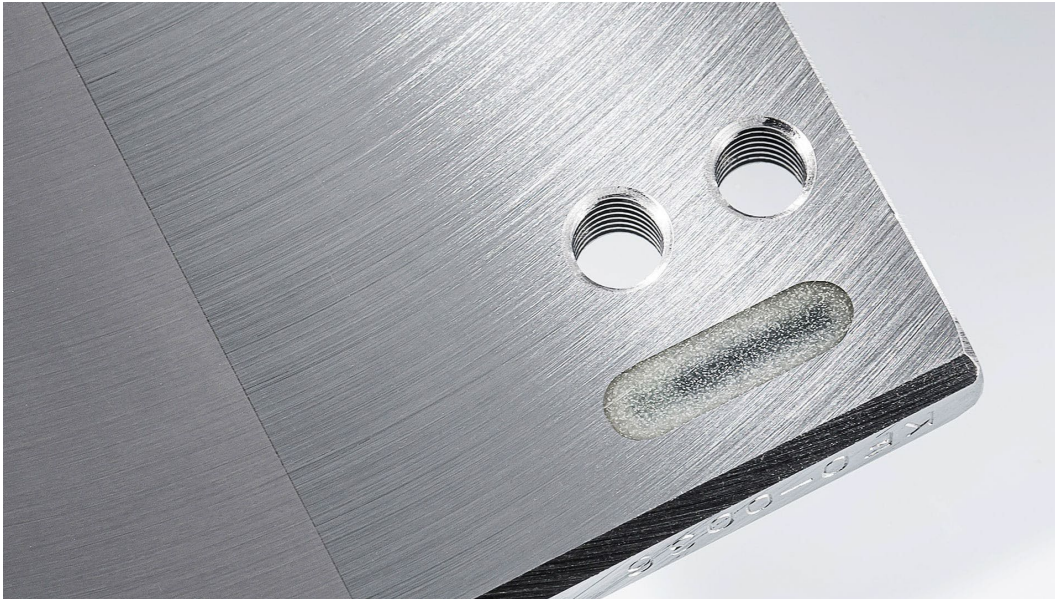
Klein aber wichtig: Der RFID-Chip ist das Herzstück von IntelliKnife